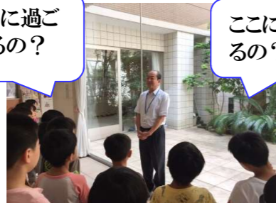
施設長から施設の説明